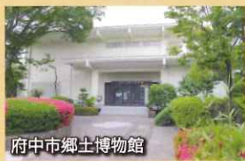
府中市郷土博物館