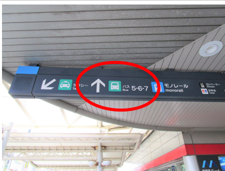
⑦ 途中案内板があります。バス乗り場⑤番方面へ。