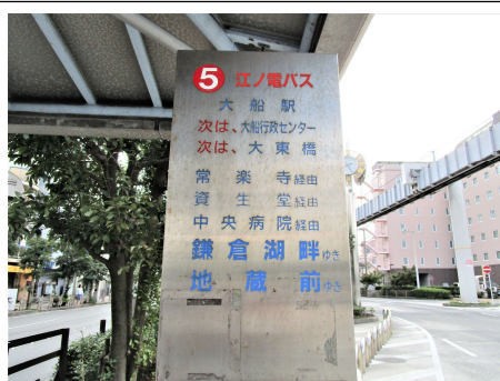
⑪ 一番奥のバス停、⑤番乗り場が今泉 ANNEX に行くバス停です。降車は「今泉」です。