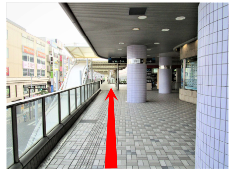
⑥ 「バス」、「モノレール」方面にまっすぐ歩いて行きます。