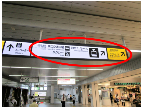
② 東口交通広場・湘南モノレール方面へ歩きます。