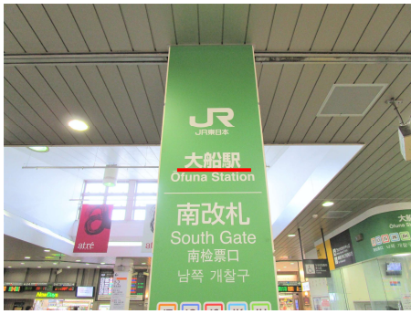
① 大船駅 南改札側の改札口を出ます。