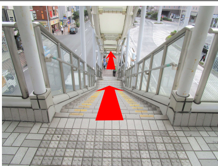
⑩ 階段が見えてくるので、この階段を降ります。