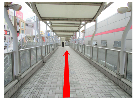
⑨ しばらくこのまま歩きます。