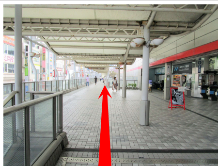
⑧ 案内板を超え、右側にモノレール乗り場があります。さらにまっすぐ歩きます。