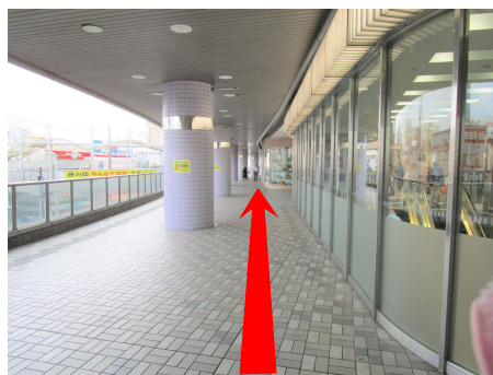
⑤ しばらくこの道を歩きます。