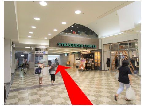
③ スターバックスコーヒーの看板の下を歩き、その先の階段を降ります。