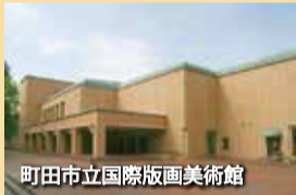
町田市立国際版画美術館