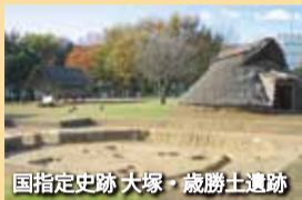
国指定史跡 大塚・歳勝土遺跡