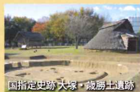
国指定史跡大塚・歳勝土遺跡