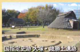
国指定史跡大塚・歳勝土遺跡